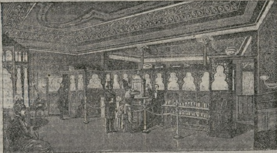
FUENTE Y SALON DE DESCANSO

Por decreto de la Alcaldía de Madrid, y previo dictamen de la Comisión quinta, se aprobaron con fecha de 22 de Julio de 1887 las bases para la administración gratuita de las aguas é inhalaciones azoadas á los enfermos que se asisten por la Beneficencia municipal; pudiendo mandar en virtud de esta concesión cada casa de Socorro cuatro enfermos diarios, ó sea un total de 40 enfermos cada día, que reciban los beneficios de este tratamiento completamente gratuito.