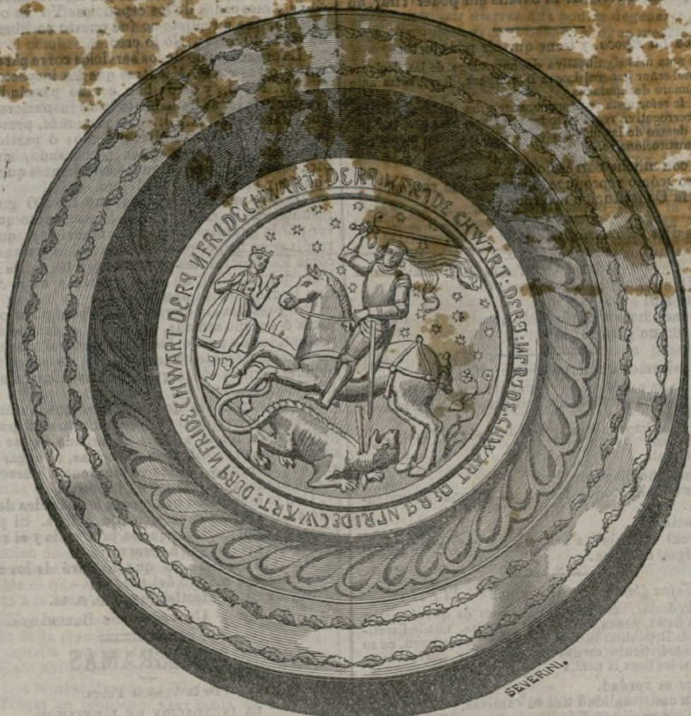
Plato de latón del siglo XV.

El hospital consta de 17 edificios, algunos de ellos de 500 pies de largo; el área total asciende á 1.200 metros cuadrados.