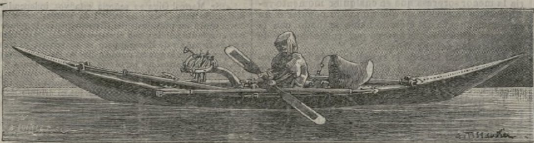
Trineos y embarcaciones de los esquimales.