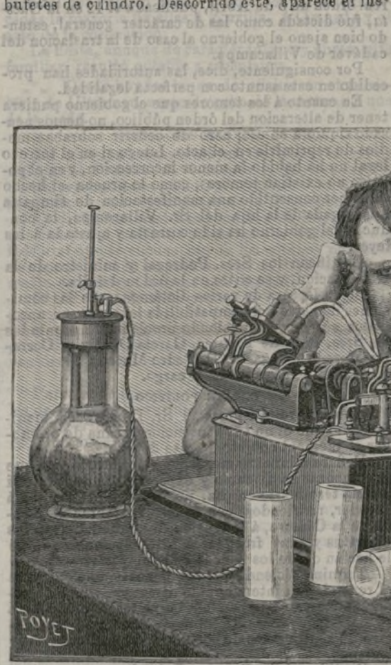
El fonógrafo de Edison.

A la amabilidad del Sr. Hemmer, ingeniero de la casa de Edison, y á cuyo cargo corre toda la instalación, debo el haber podido disfrutar particularmente, durante más de una hora, de la audición del mágico aparato. En medio de las instalaciones, que rodea grueso cable de seda roja, se ha construido para su uso un elegante gabinete tapizado de tela azul brocado, cuyo espesor impide penetrar los ruidos del exterior. Una serie de cómodas butacas forradas de terciopelo azulado, en torno de una mesa donde no se escasea el riquísimo gin cotel , con un mueble esculpido y un gran piano de cola; la estancia tiene todo el carácter de un rico saloncito embellecido por la clásica y generosa hospitalidad del yankee . En un extremo, y adosada á la pared, luce una especie de escritorio de caoba con cajones á la izquierda, y cerrado á la manera de los bufetes de cilindro. Descorrido éste, aparece el ins-