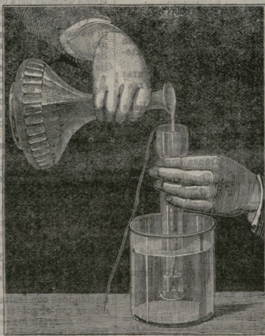
Igualdad de las presiones.

ria, junto a la tienda de objetos de escritorio, en la esquina de la calle de los Reyes comienzan a formar- se grupitos de escolares, que en seguida enredan con- versación despus de repartirse la indispensable ronda de pitillos. Aquella numerosa turba de mozos chispeantes, alborotados, decididos, entusiastas, frescos y jóvenes constituye algo como nuestro Barrio Latino; el que más de entre ellos pisó la clase media decena de veces; ninguno sabe por dónde va el catedrático de sus explicaciones ni que marcha lleva la asignatura y fian en que algún compañero les preste los apuntes; todo se reduce a darse un mal mes de Mayo. Allí se habla de Cánovas y Sa- gasta y se comenta la sesión de Cortés de la víspera y se trata de política europea y se tutea a Bismarck y a Carnot, todo revuelto con la noticia que trae este re-