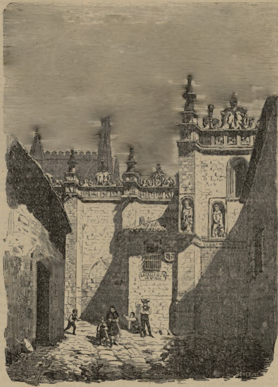
Calle de la Muerte ó la Vida.—Avila.

Así que si pululan por Madrid 80 rompecabezas, calculando que cada uno lleva tres vagos como dotación, representan 180 jóvenes arrancados al trabajo.