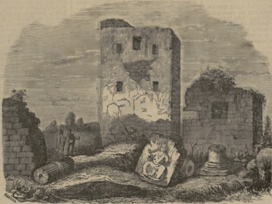
Ruinas de Cástulo.

biere tenido de ella un conocimiento más filosófico.