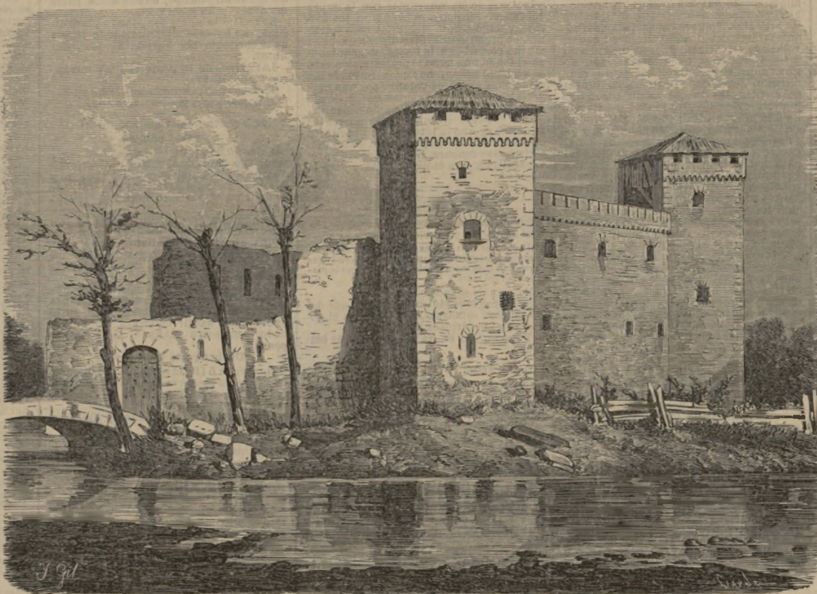
Ruinas del castillo donde según la tradición se celebró el casamiento del Cid.