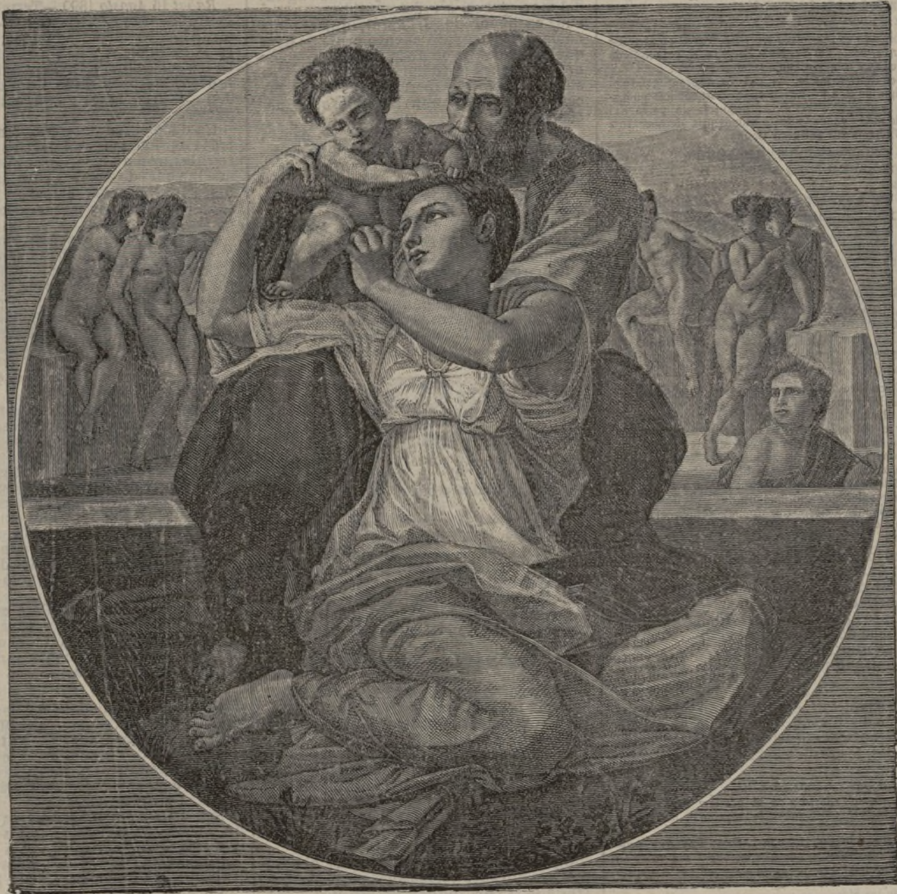
Un cuadro de Miguel Angel.

neiro, que me dejó admirado. Tanto y tan nuevo era lo que a mis ojos se presentaba. Dimos fondo; y yo creo que nada mejor, por mi parte, en este momento que hacer punto.