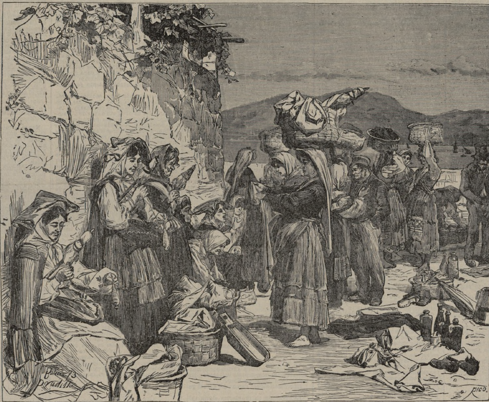
Un mercado en Vigo.