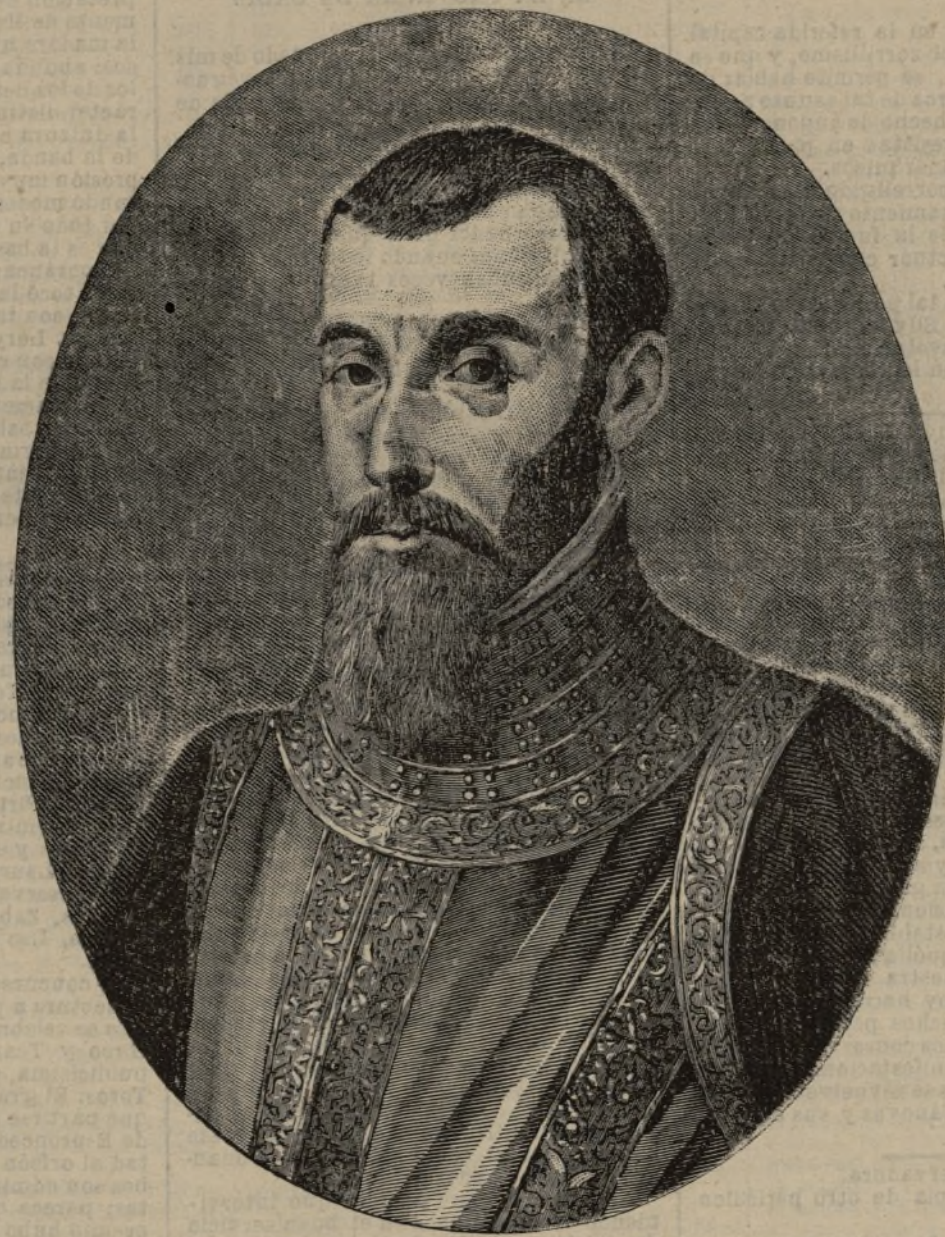
Pedro de la Gasca.

vampirismo; abre el cadáver, le traspasa el corazón con alfileres, espinas ó una estaca; después se arroja su cadáver a las llamas, y una vez reducido a cenizas su cuerpo y encerradas en una fosa, el vampiro entra en la común y silenciosa condición de los muertos ordinarios y queda imposibilitado de repetir sus correrías nocturnas, turbando el reposo de los vivos.