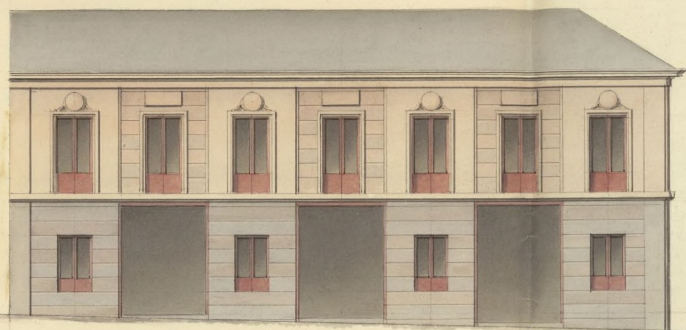
Fachada al Camino antiguo de Tuencarral.