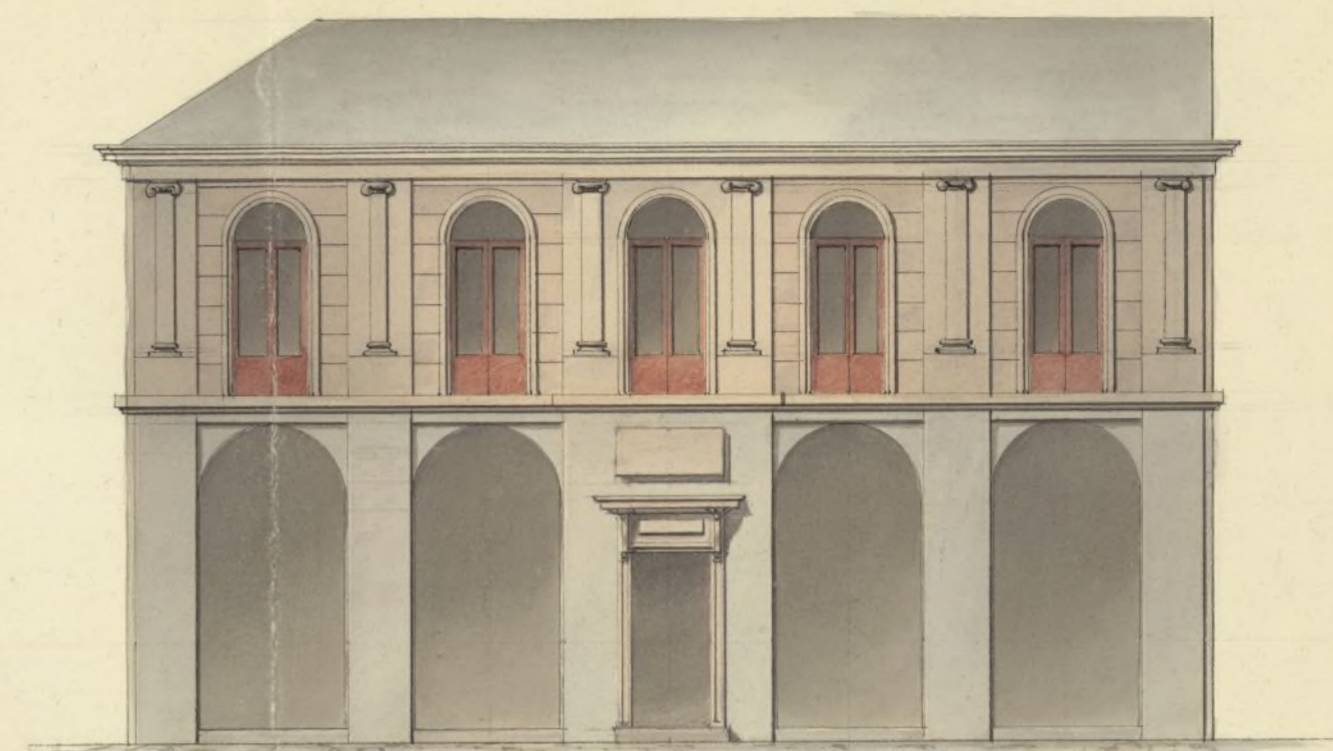
Plazuela circular del Camino N.º de Francia.