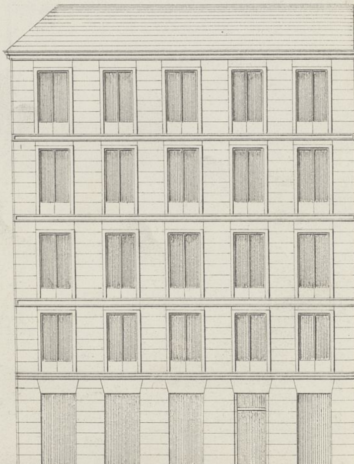
FACHADA DE LA CALLE DEL CARMEN