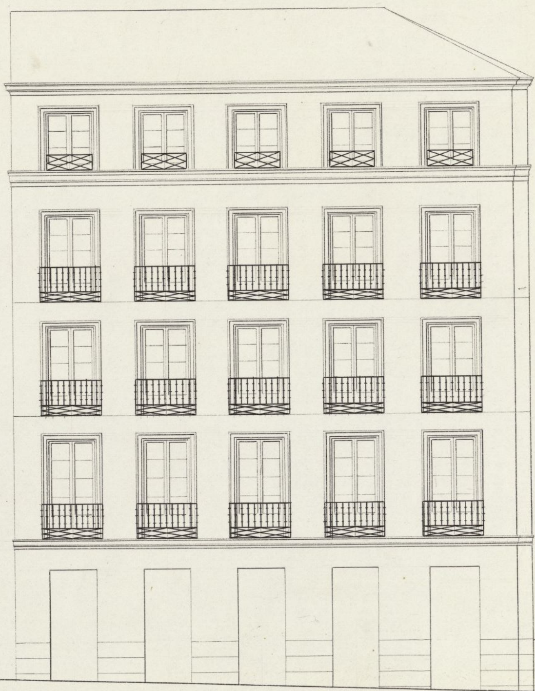
Fachada de la Travesía del Conde Duque.