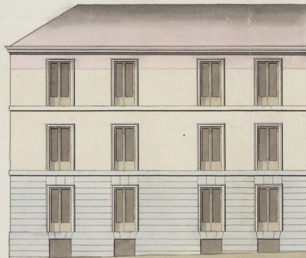
Calle de Santa Maria