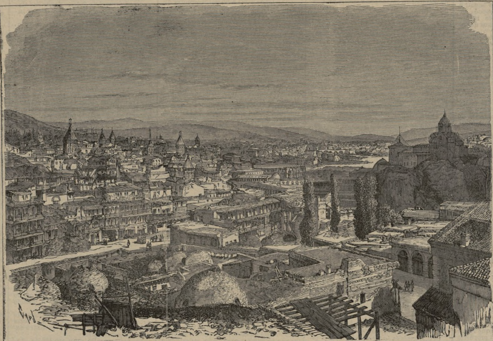
La ciudad de Tiflis.