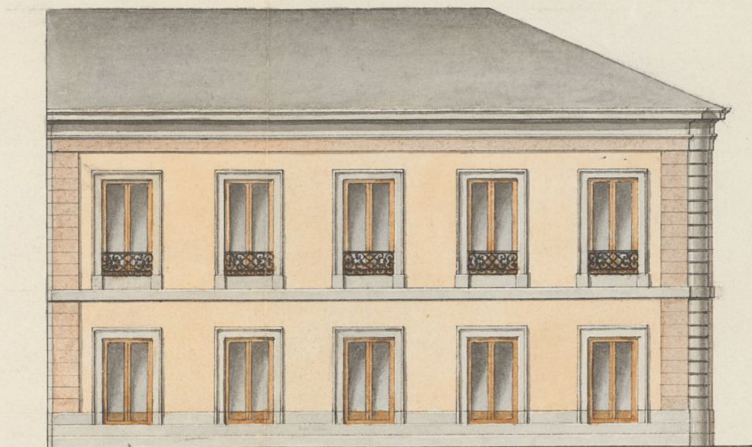
Fachada a la nueva Calle de Fierro.

Proyecto de la casa que se ha de construir extramuros de la Puerta de Bisagra, y sobre el sitio llamado de los Salitres inmediato a la Tab. a de Tapices.