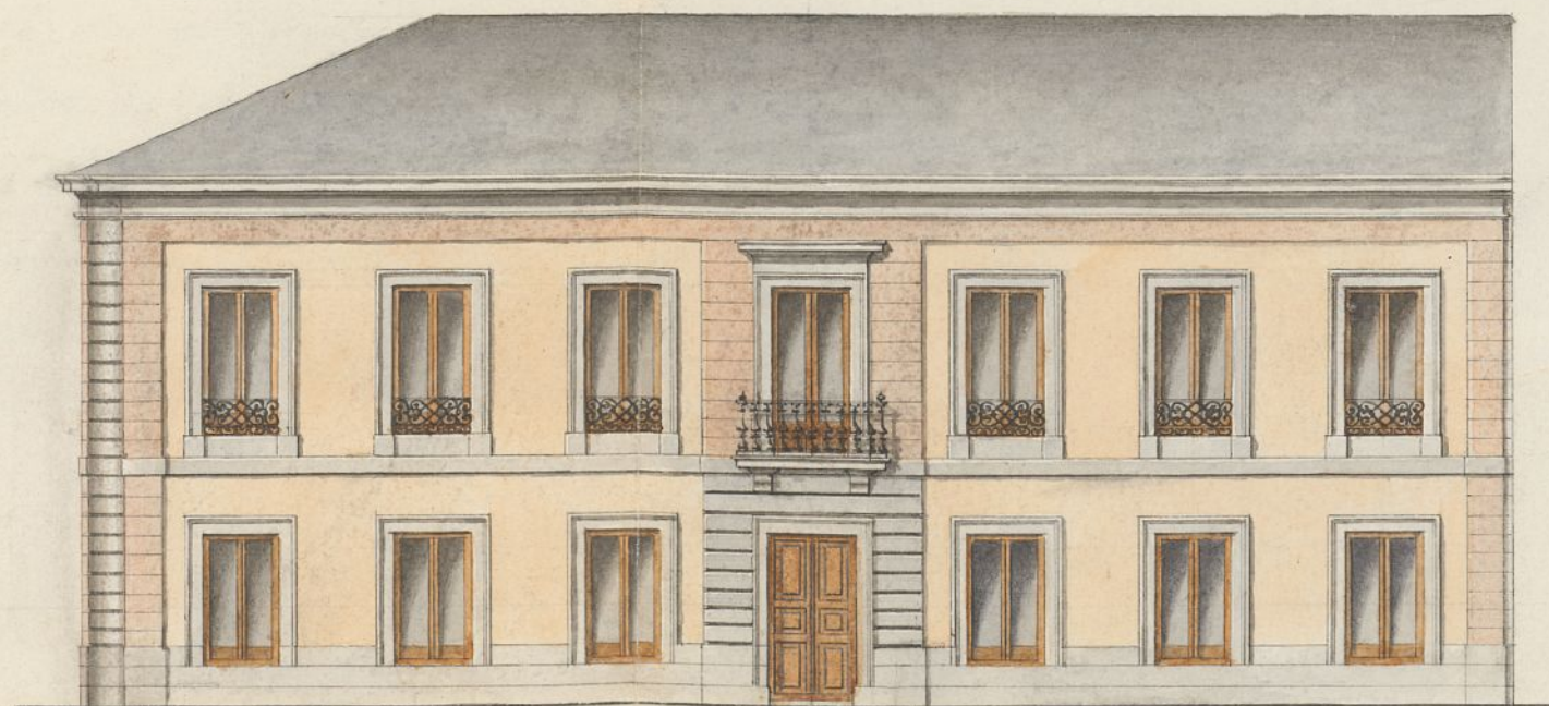
Fachada al Paseo de la Ronda.