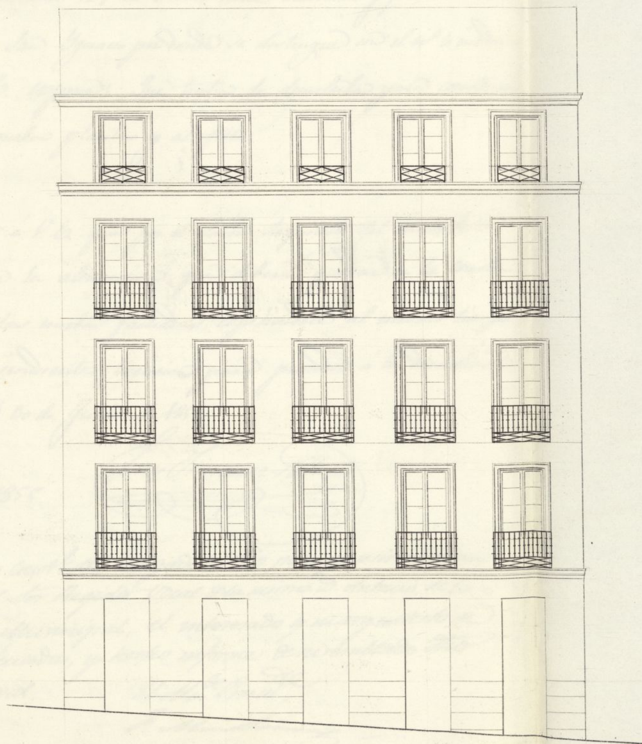
Fachada de la calle de los Reyes.