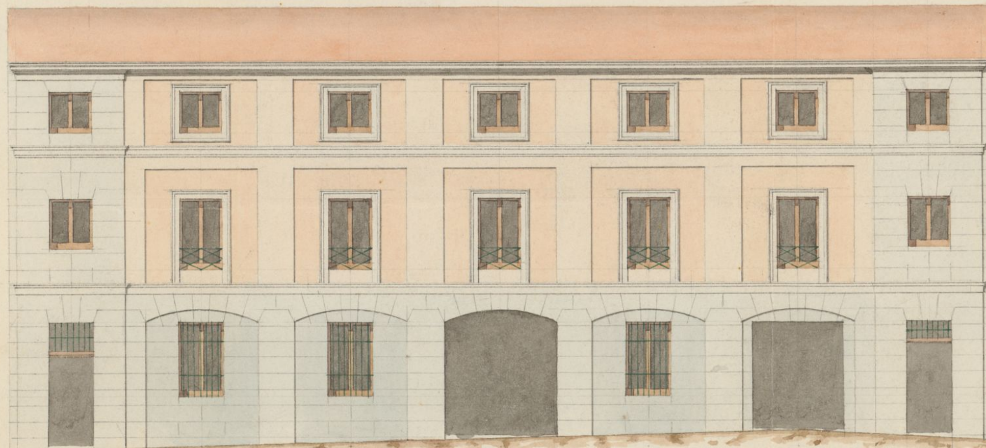
Fachada principal, calle de Monserrat N. o 4.