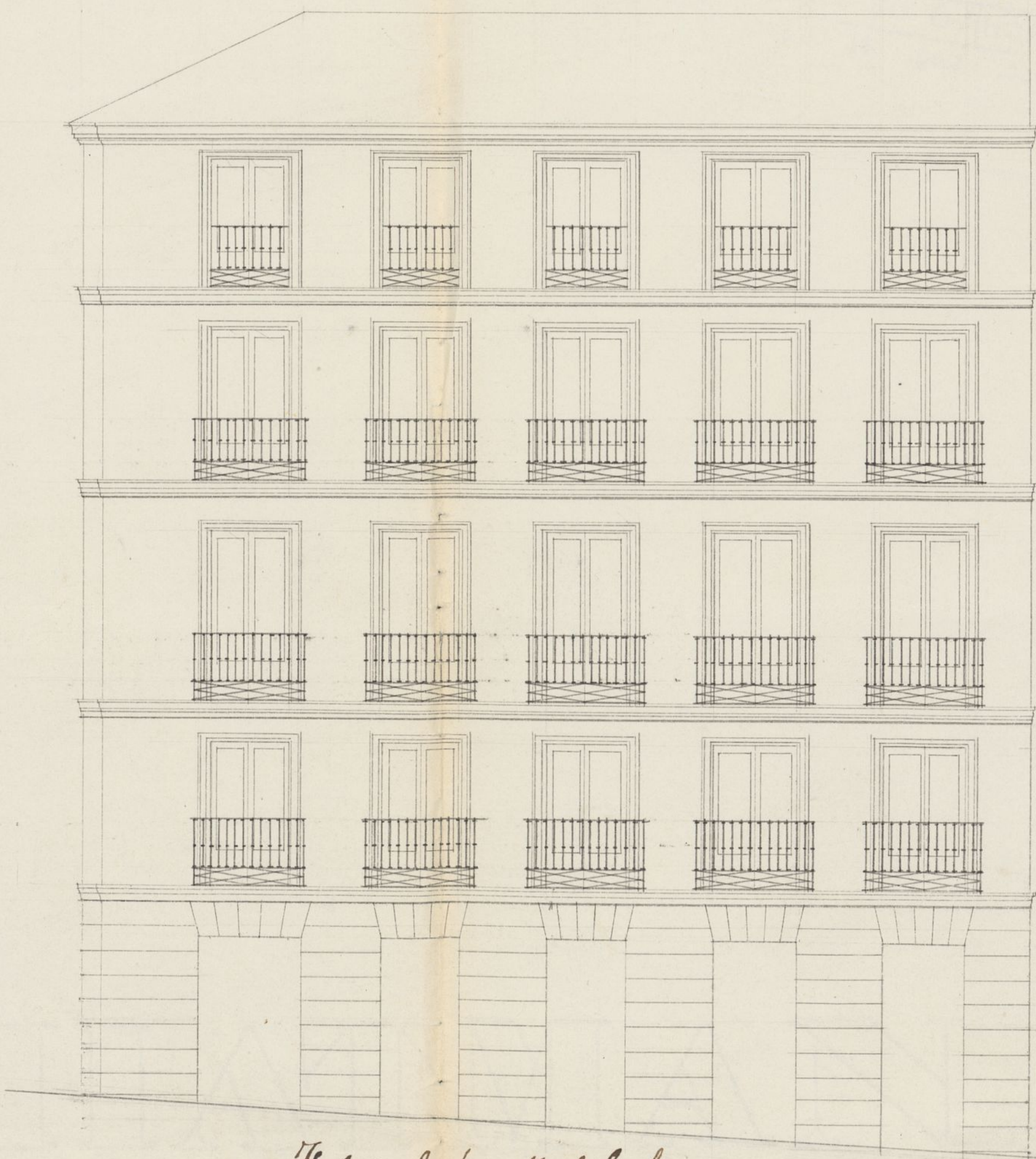
Fachada de la calle del Lopeyo.