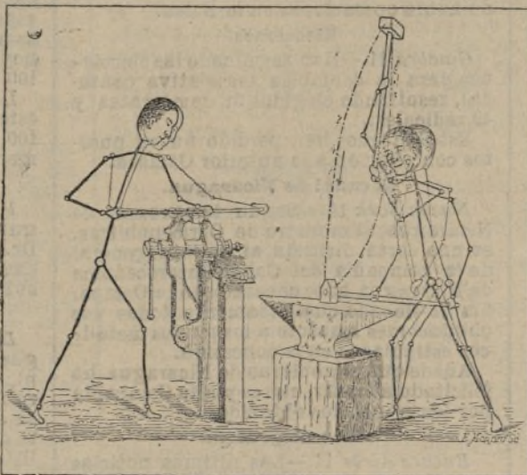
El torno y el yunque.

los crepúsculos toman sus denominaciones poéticas de Rosario Vespertino ó Rosario de la Aurora. Nada tan motivado a irreverencias, dicho sea con perdón de las clericales, como esta vieja costumbre de llevar en procesión a hora descompasada por calles y plazas las imágenes, auto-cuya faz, sin que nadie pueda evitarlo, no sólo juran y perjuran los devotos ebrios con el aguardiente de la mañana, sino que en reyertas por todo extremo escandalosísimas las emprenden a farolazos con las rondas de trasnochadores halladas en su carrera. El vulgo nuestro, muy fanático, pero a quien a pesar de su fanatismo no le duelen prendas, resume lo que son tales manifestaciones religiosas cuando, al encarecer el desenlace tumultuario de cualquier reunión, dice en volteriano aforismo que acabó como el Rosario de la Aurora.