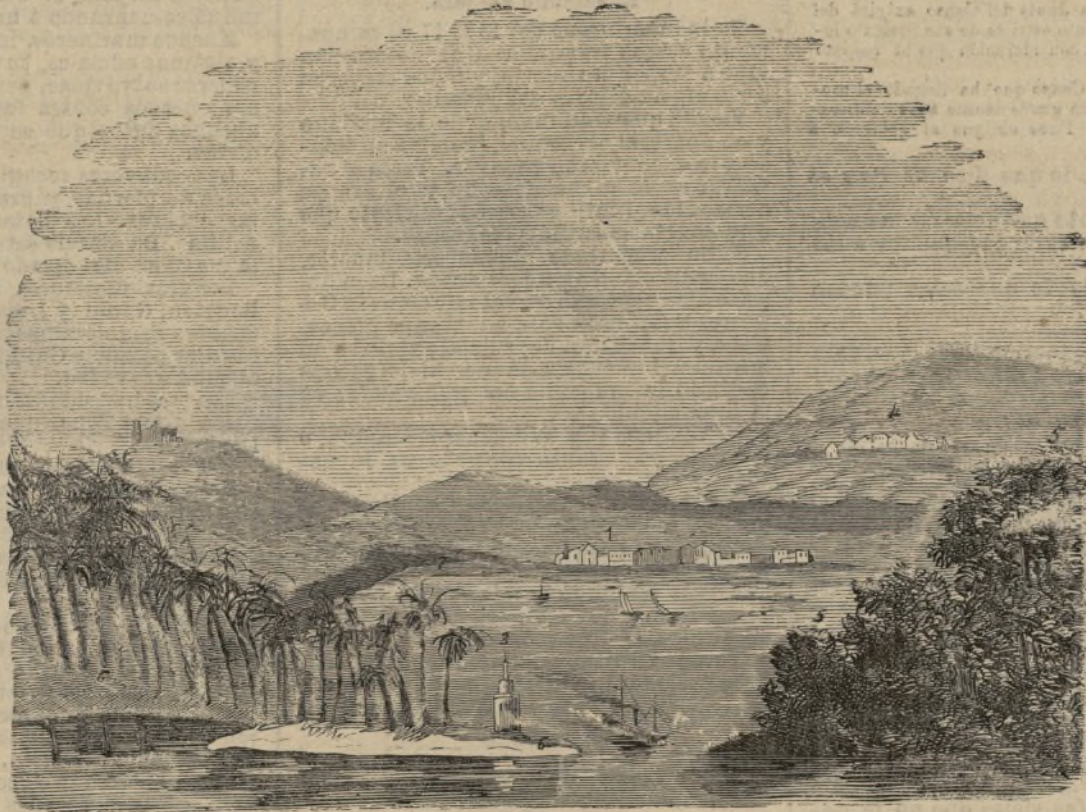
La bahía de Santa Isabel.

Cuando este fenómeno se verifica, en unos dos ó tres días, una masa colosal de agua, que pasa de diez millones de metros cúbicos, se fragua un paso á través de los ventisqueros del Aletich, desapareciendo con estrépito horrible por las grietas y barrancos de los Alpes hasta llegar al valle del Roldán. Si el lago se vaciase de repente, el citado río desbordaría, inundando toda la comarca.