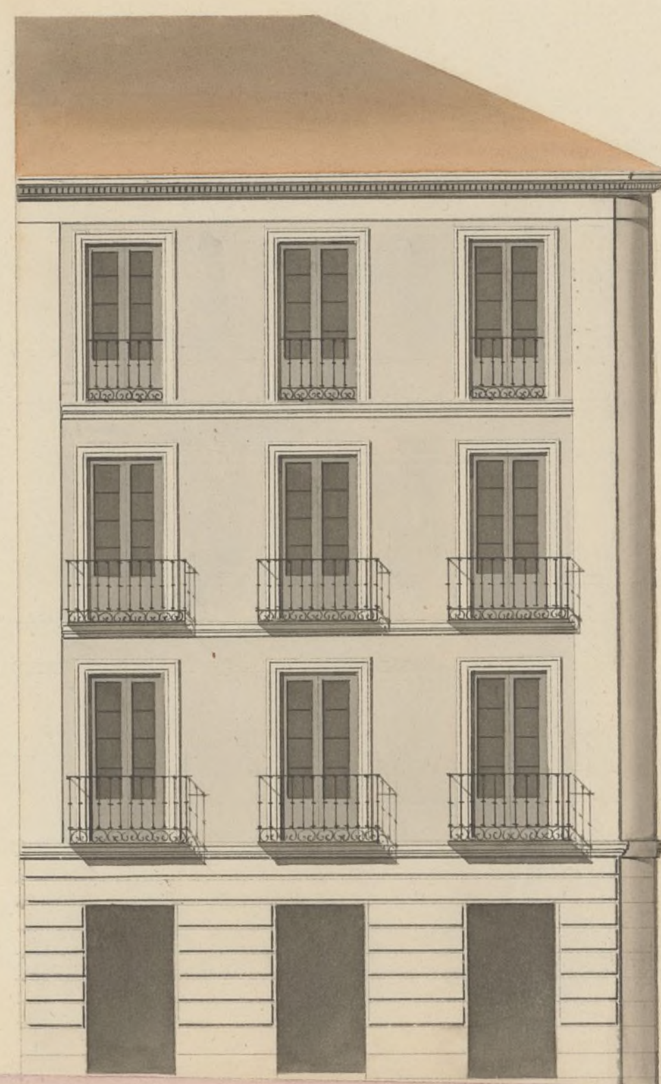
Fachada a la calle del Tribulete.