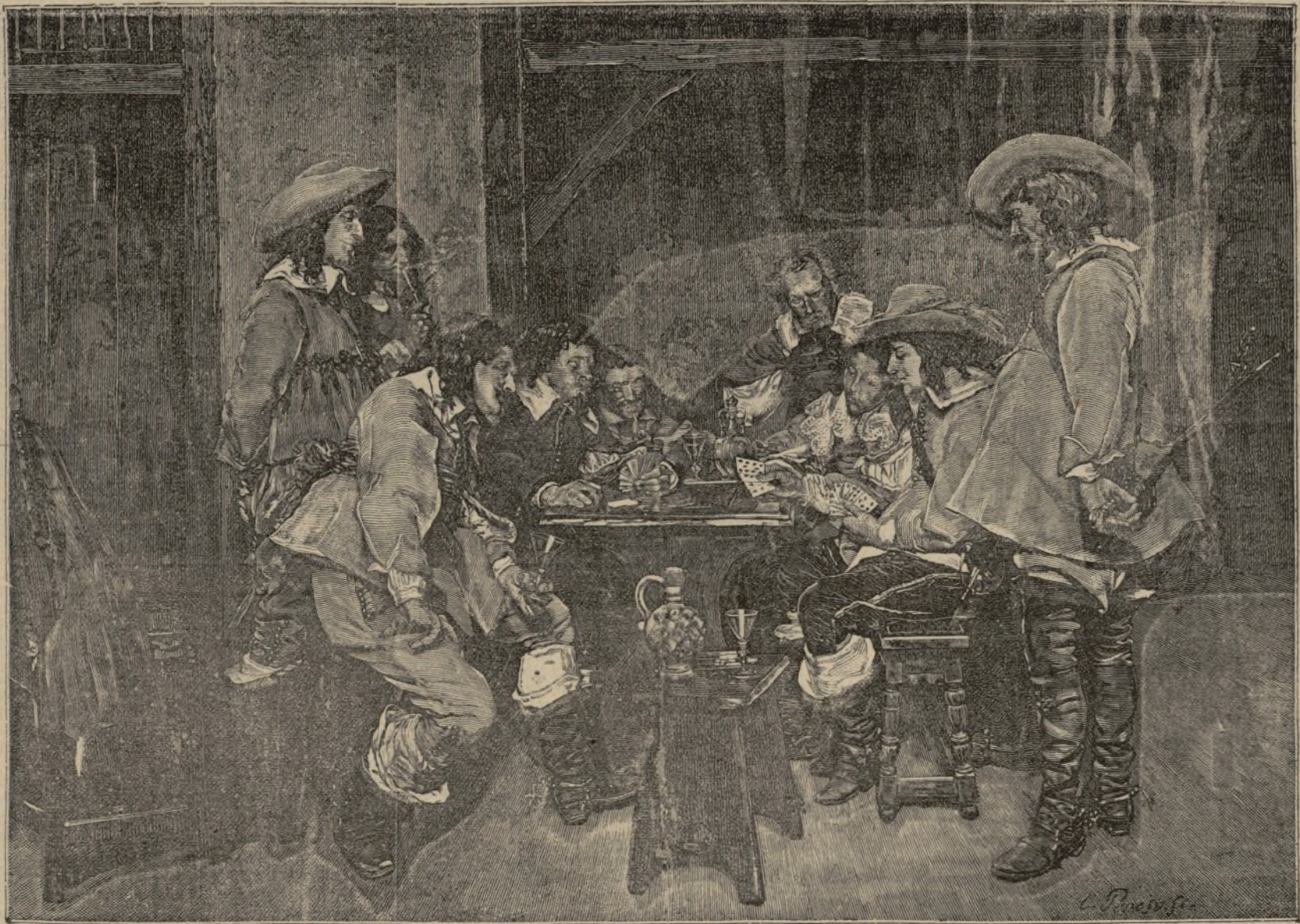
El cuerpo de guardia.