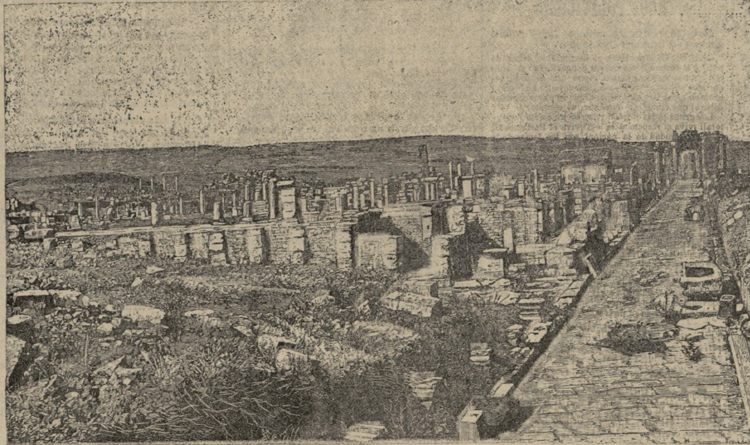
Ruinas romanas de Timgad.

«Aún hay más diferencias entre ambos inventos y muy importantes.»