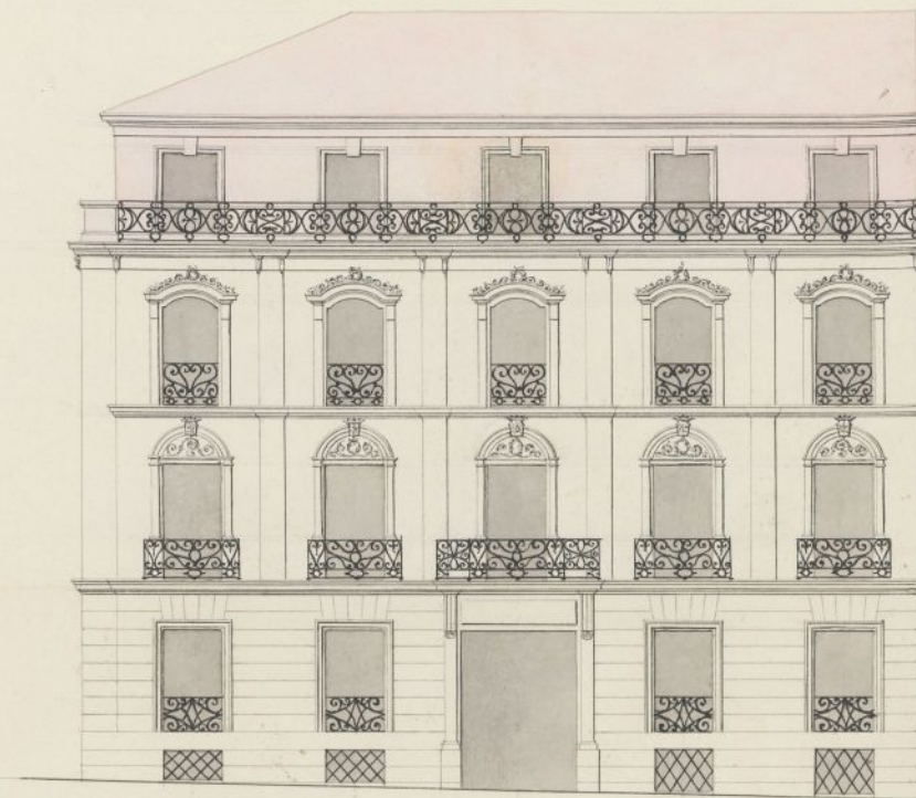
Fachoda á la calle Ancha.

Diseno de fachada para la casa que de nueva planta trata construir el Exmo Sr. Conde de Aludia en la Calle de la Palma la cual se distingue con el n.º 55, como tambien el crucimiento de un piso antiguo marcados con aguada rosada y nueva dueracion en la contigua que vuestre por la Calle Ancha de San Bernardo señalada con el n.º 16.