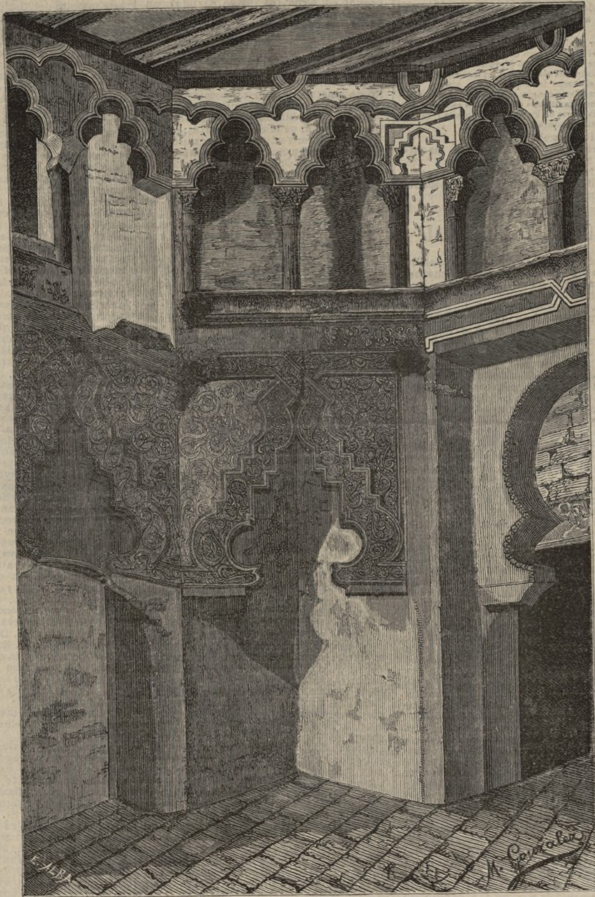
ZARAGOZA.—Salón árabe de la Aljafería.

zas fusibles y de cortacircuitos dobles y adecuados en todos los puntos de unión de derivaciones calcos ó grandes. Nos atrevemos á afirmar que tales piezas no existían á los extremos de los conductores fortuitamente contactados; de haber existido, su fusión instantánea no hubiera dado lugar a que una chispa prolongada llegase á prender una materia ó una tela.