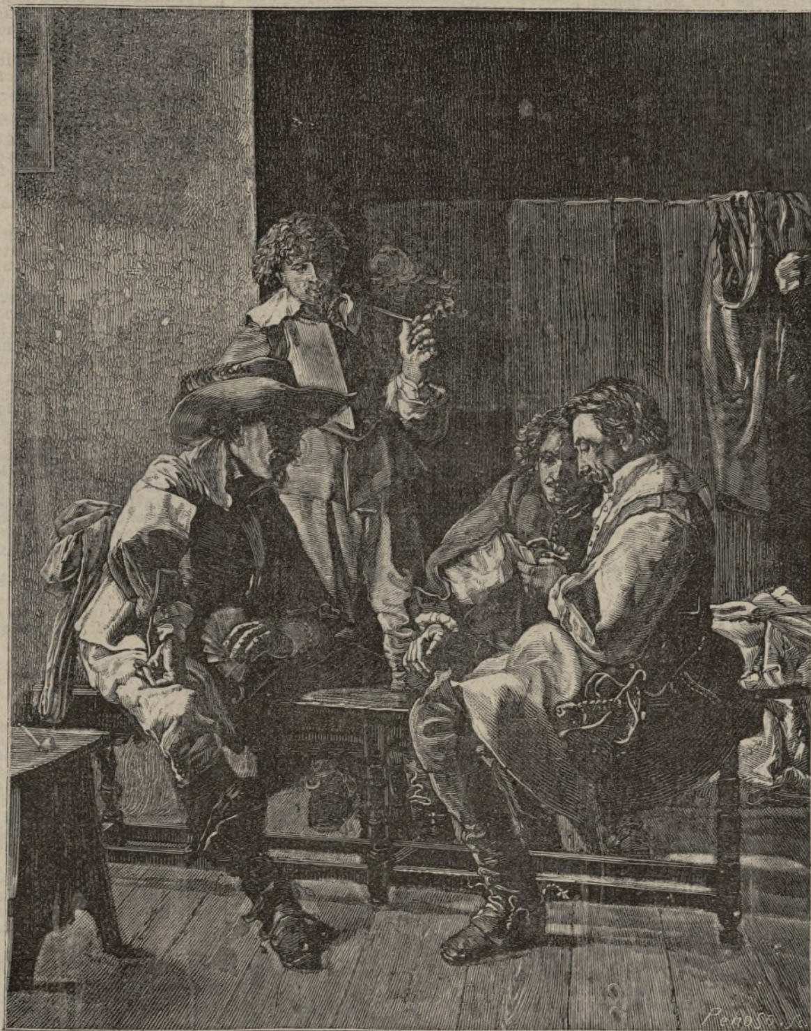
Una partida de naipes.