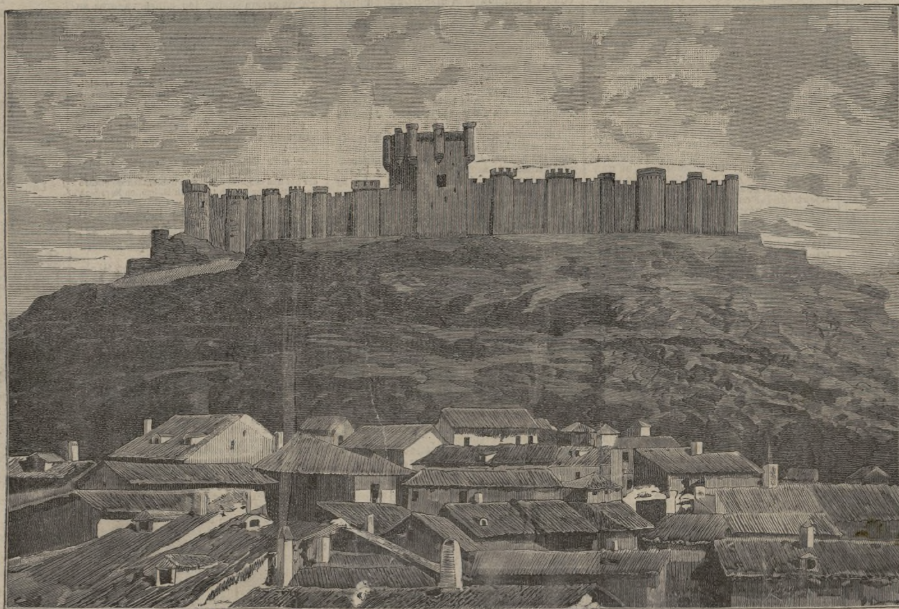
Castillo de Peñafiel.