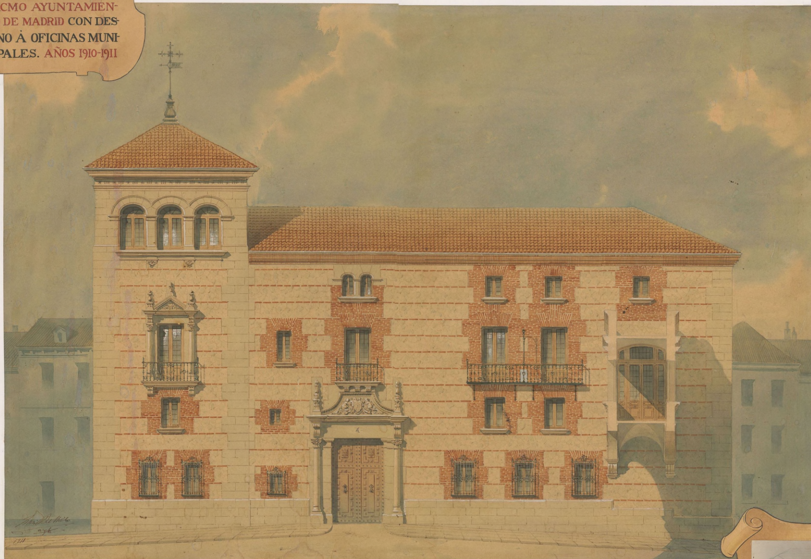
Fachada a la Plaza de la Villa. (De nueva construcción)

PROYECTO DE RESTAU- RACION Y AMPLIACION DE LA CASA DE CISNE- ROS ADQUIRIDA POR EL EXCMO AYUNTAMEN- TO DE MADRID CON DES- TINO A OFICINAS MUNI- CIPALES. AÑOS 1910-1911