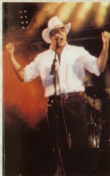
Montana Sábado 27 a las 23:15 h.