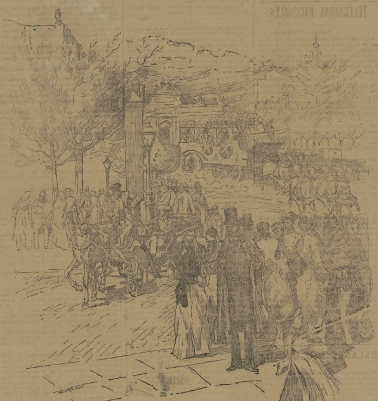
¡A LOS TOROS!

THE NEW YORK HERALD participa que el ministro de Turquía en Was-