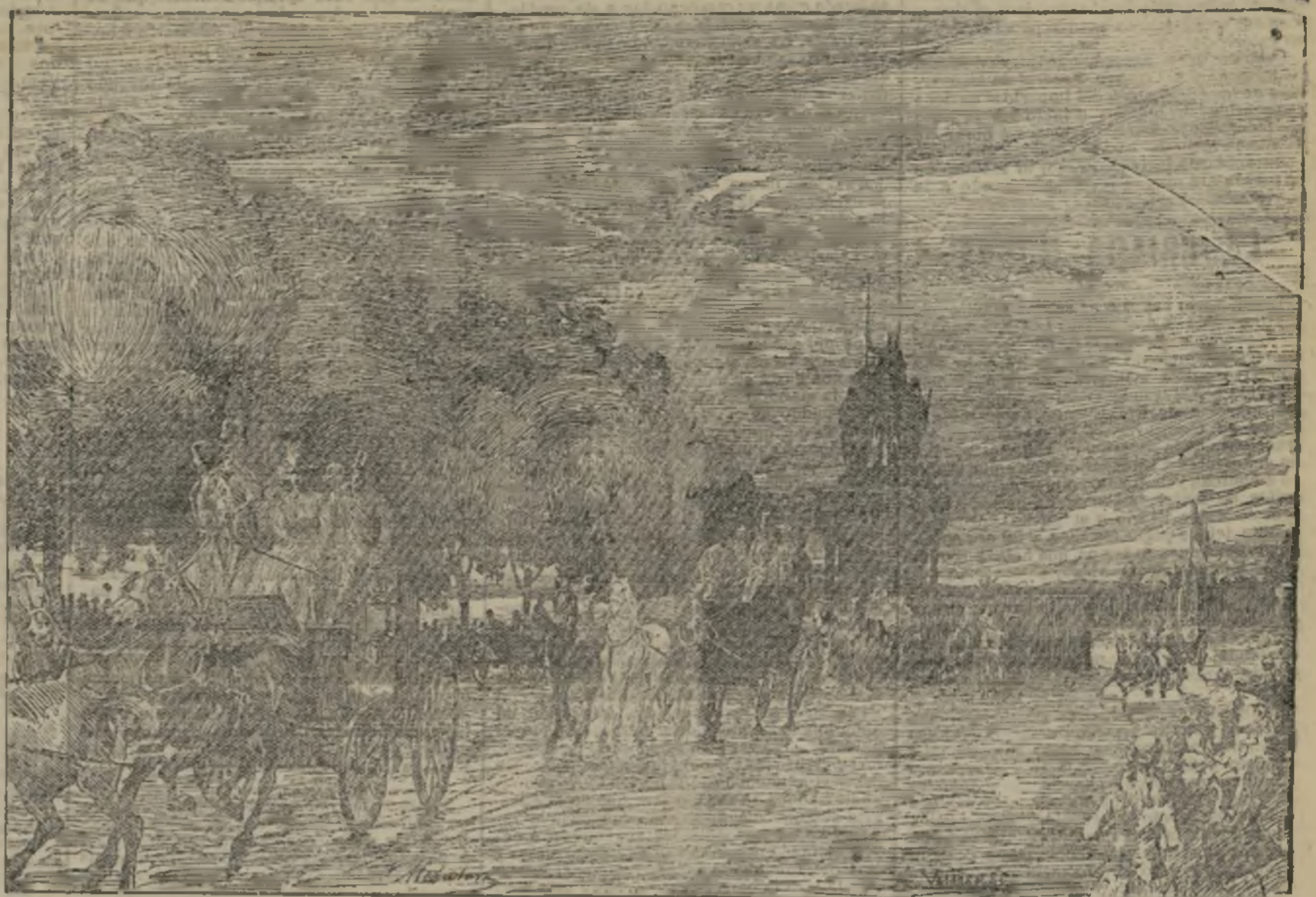
DESPUES DE LAS CARRERAS

Y respecto de eso de la postulación, claro es que el Sr. Cánovas tampoco se encuentra en semejante estado. Postulado quisieran ver algunos partidarios, pero ¡puff! Digan lo que quieran las oposiciones, él se encuentra firmé y tenso que tenso, igual que Manolito Gar-