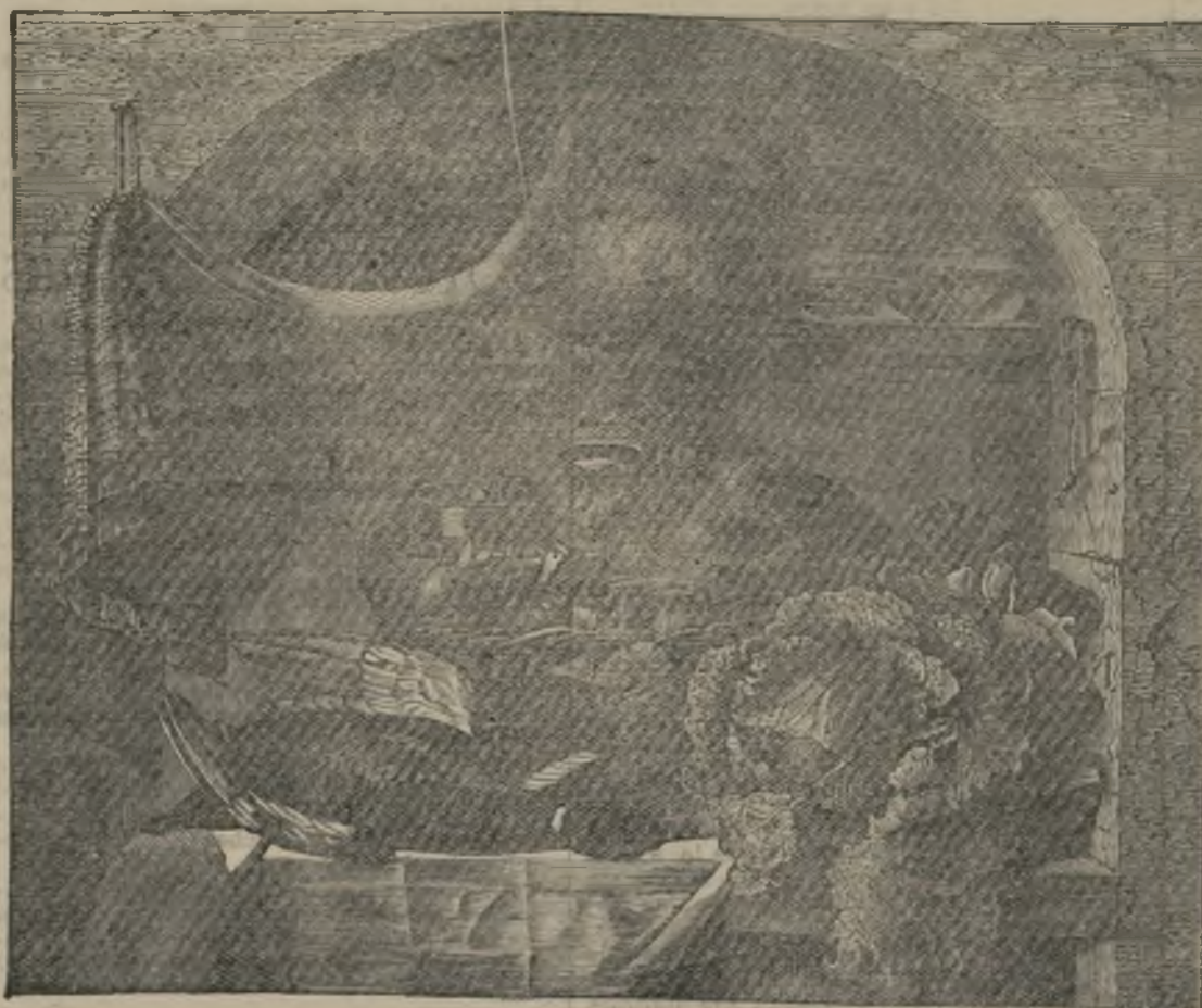
UN CUADRO DE TENIERS

El Sr. Fortis presenta y defiende una orden del día demostrando la inoportunidad de semejante debate en tanto que siga la lucha armada.—Fabra.