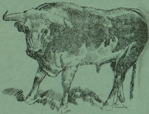
Desertor, berrendo lucero, de Moreno Santa María.