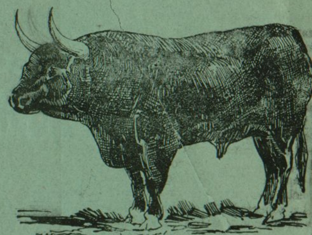
Primoroso, negro, de Izaguirre.