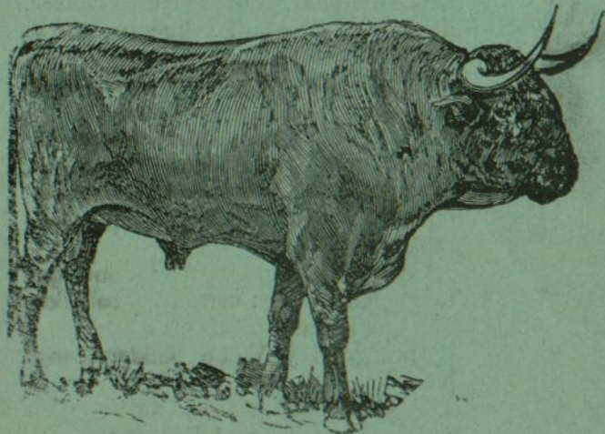
Pescadero, retinto albarão, de Saturio Vela.