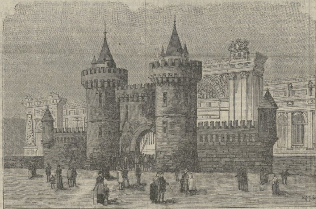
El Palacio de la Guerra.