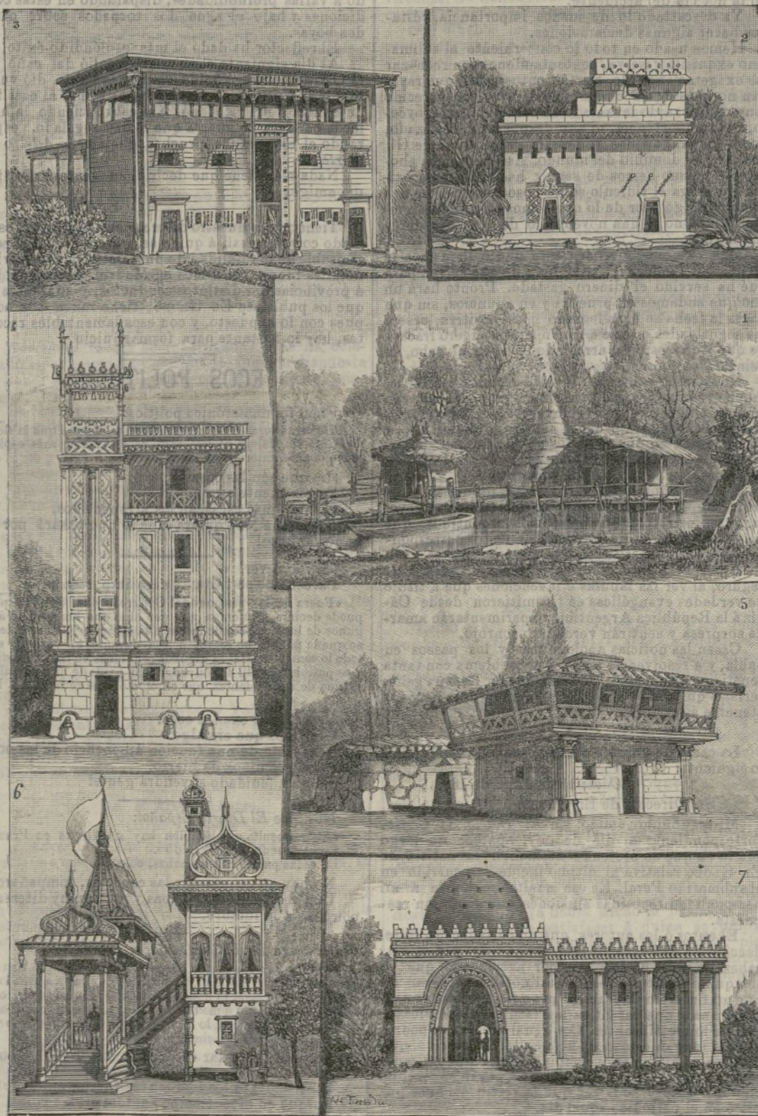
1. Ciudad lacustre.—2. Monumento de Méjico, Incas.—3. Egipto.—4. Fenicia.—5. Etrusca.—6. Rusia.—7. Persia.

Mr. Mascart, que se halla al frente del primer instituto de este género que hay en Francia, no ha olvidado ningún detalle para que el nuevo observatorio responda á los fines para que fué destinado por Mr. Eiffel.