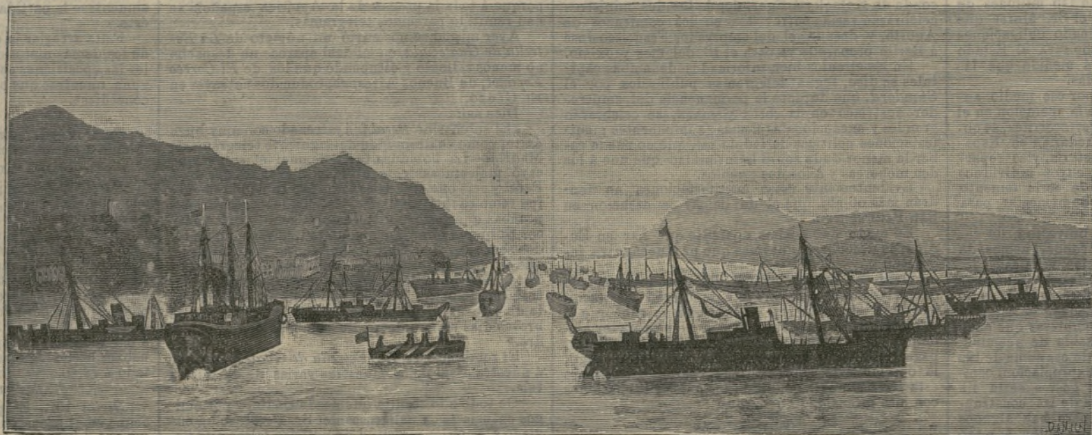
La villa y plaza en guerra de Santofía.

El servicio de las diferentes líneas aéreas, está asegurado por 160.000 estaciones.