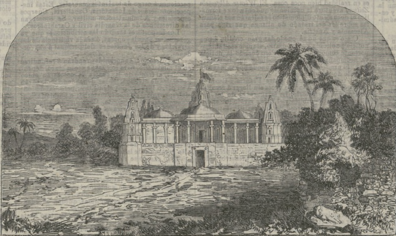
Templo de Kairah.

Todas las secciones del edificio pueden montarse y desmontarse fácilmente, y regularse su ajuste á medida del deseo de los ocupantes.