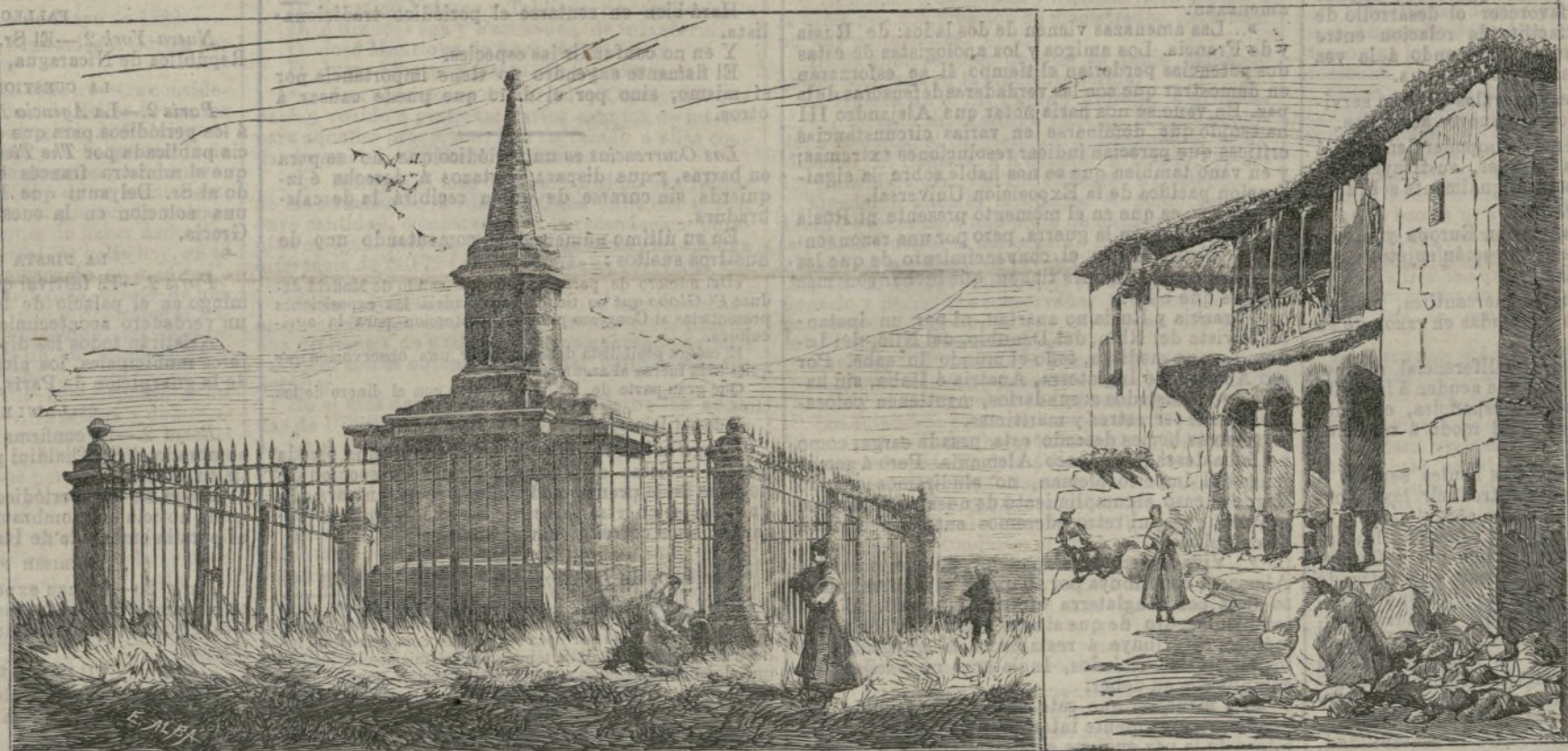
Hospedería de Valcabe y monumento erigido a Cristóbal Colón.