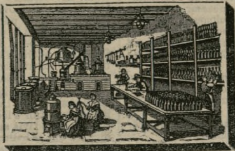
INTERIOR DE LA SALA DE ALAMBIQUES