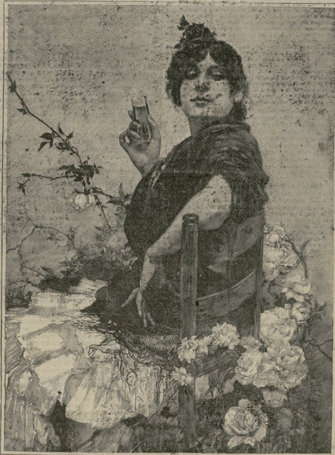
(POR USTEDES!—(Cuadro de D. Manuel de la Rosa.)

Dicen enantos han visto el cadáver que el caso es verdaderamente notable, pues miss Adelaida conserva todos los rasgos de su fisonomía y hasta un lunarcito muy gracioso que tenía encima del labio inferior.