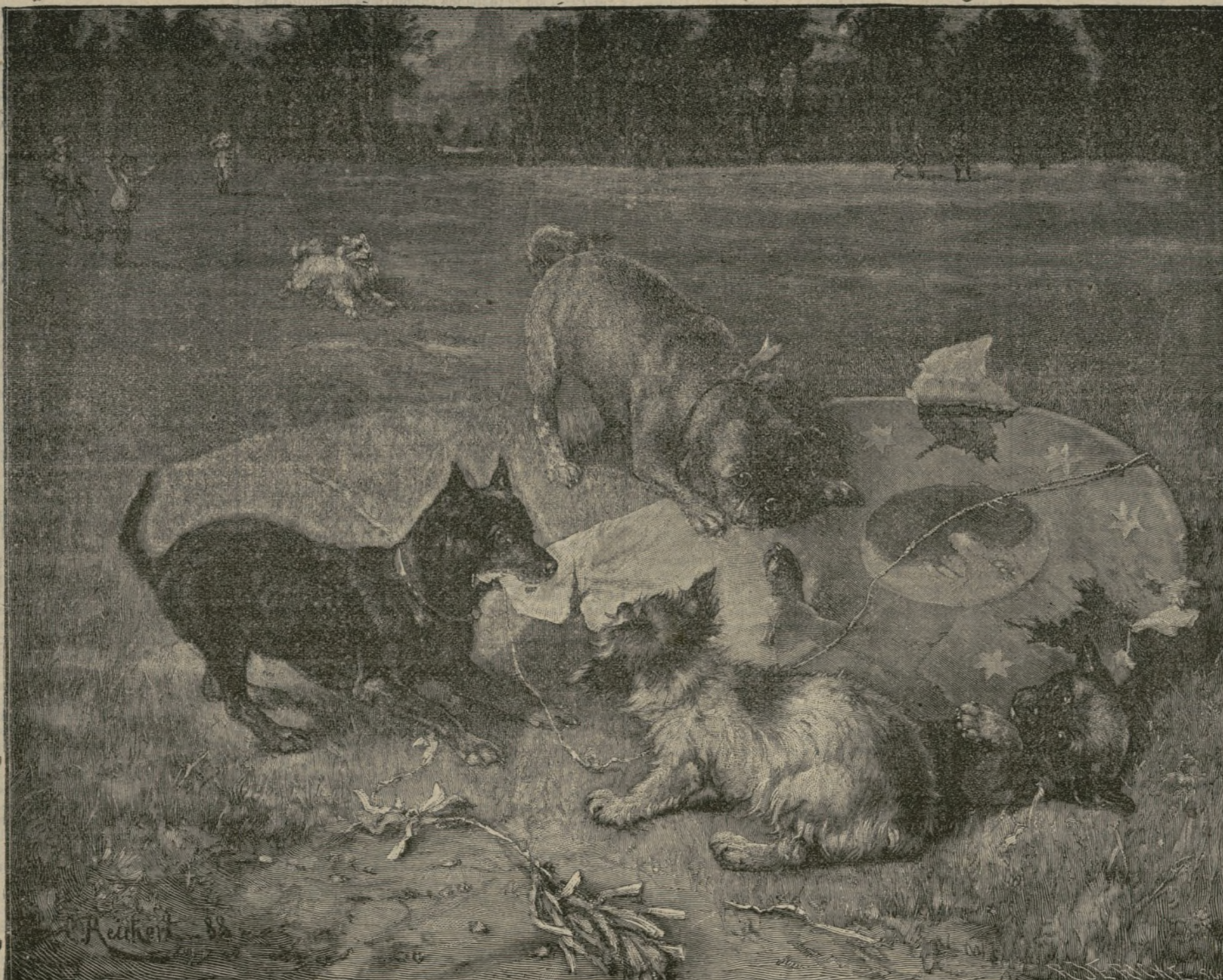
La triple alianza. (Cuadro de C. Reichert).

Aunque Júpiter es 1 330, Saturno 857, Urano 83, y Neptuno 107 veces más grande que la Tierra, solamente son respectivamente 330, 101, 14 y 19 veces más pesados.