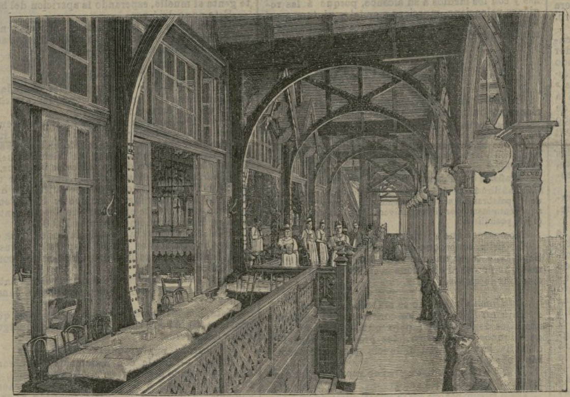
Una galería lateral del primer piso de la torre Eiffel.

A un extremo de la Avenida de la Bourdonnais,