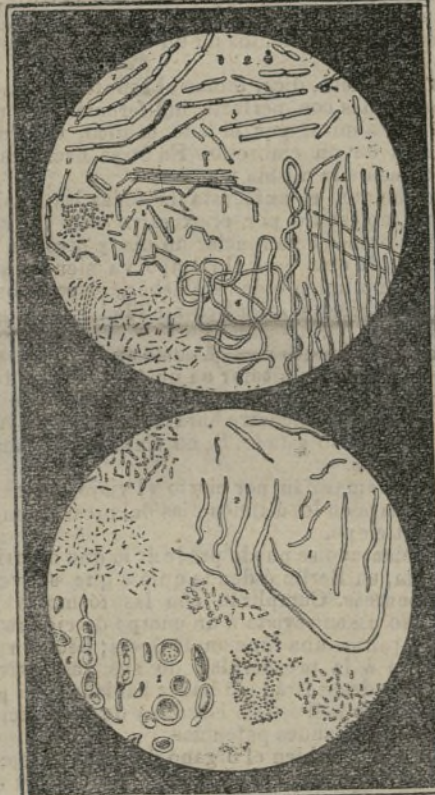
El aire que respiramos.

vida artística después de la guerra de la Independencia. Los principios del arte, que hoy contemplamos en las bellas artes, que hoy contemplamos en el propio Estado declarado independiente en el último Reglamento de Exposiciones, fueron tan humildes que merecen recordarse para enseñanza de los que hemos venido a la vida en mejores días.