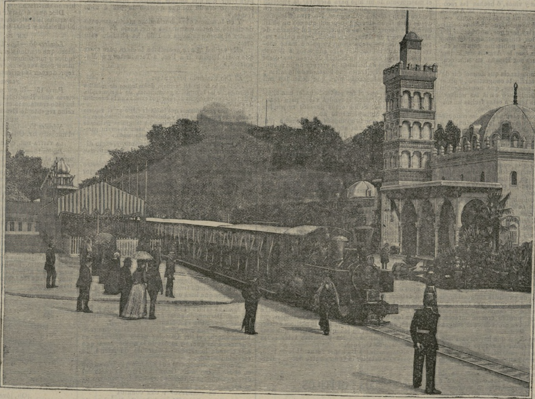
El ferrocarril de Decauville.

golpean, dicen que para evocar a Dios, pero supongo que también para despavilar a los fieles. Cuando el gong vibra, los tres bonzos se inclinan tres veces hasta besar la tierra y entonces sacuden el cascabel de madera para espantar los espíritus malignos. El oficiante lleva en la mano una flor de loto, símbolo de la naturaleza, que repetidamente sacude delante del santuario. Luego se suspenden en tres ocasiones las letanías para hacer las ofrendas de flores, frutas y agua lustral, ceremonias que el sacerdote acompaña con signos hechos con las manos y los dedos que tienen su explicación, como los de las bailarinas javanenses, pero que a los profanos nos dejan en aynas. Después descienden los celebrantes del altar y se ponen a girar de derecha a izquierda y de izquierda a derecha sin dar reposo a los dedos, y cuando ya han repetido tres veces esta danza, dirigen en procesión a los altares secundarios, donde dedican sus ofrendas a los genios de los cuatro elementos, a los de los cuatro puntos cardinales; y por último, a Dios, para lo cual vuelven al altar mayor donde co-