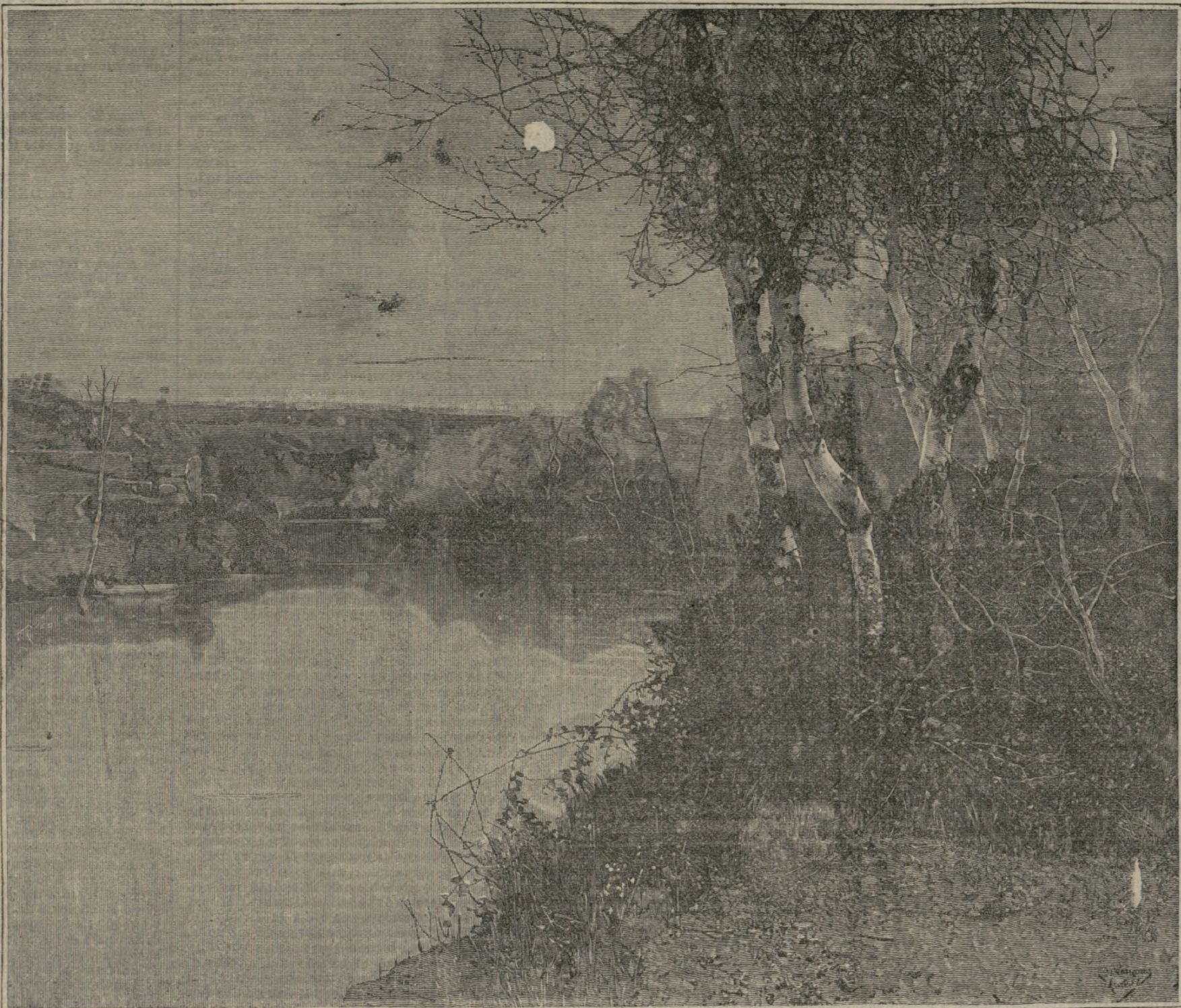
Estudio de paisaje.