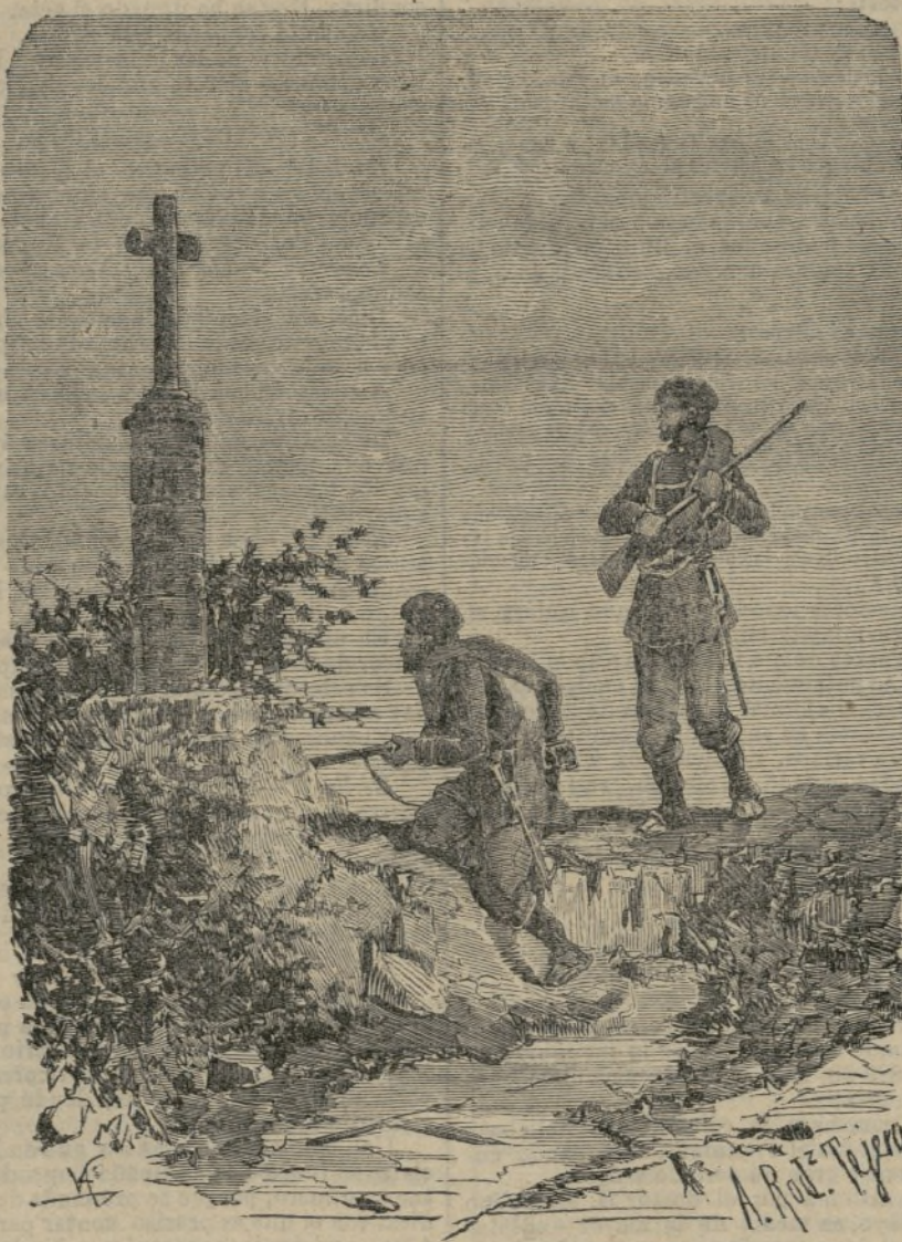
Detrás de la cruz el diablo.

Pero esa diferencia, para los profanos, no es muy