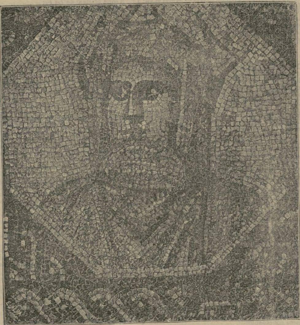
Mosaico vermicular romano.

El Sello era muy inteligente y sumamente dó- cil: durante toda su vida estuvo dedicado á trabajos de carga y transportes. Sirvió también para domes- ticar á elefantes salvajes, y hacia dos años que se hallaba ciego. Su muerte ha sido bastante sentida: sus colmillos, que tenían más de cinco pies de largo, han sido vendidos á muy buen precio.