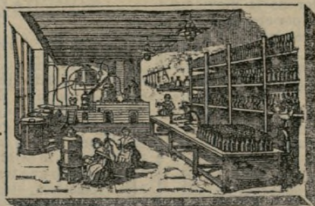
INTERIOR DE LA SALA DE ALAMBIQUES