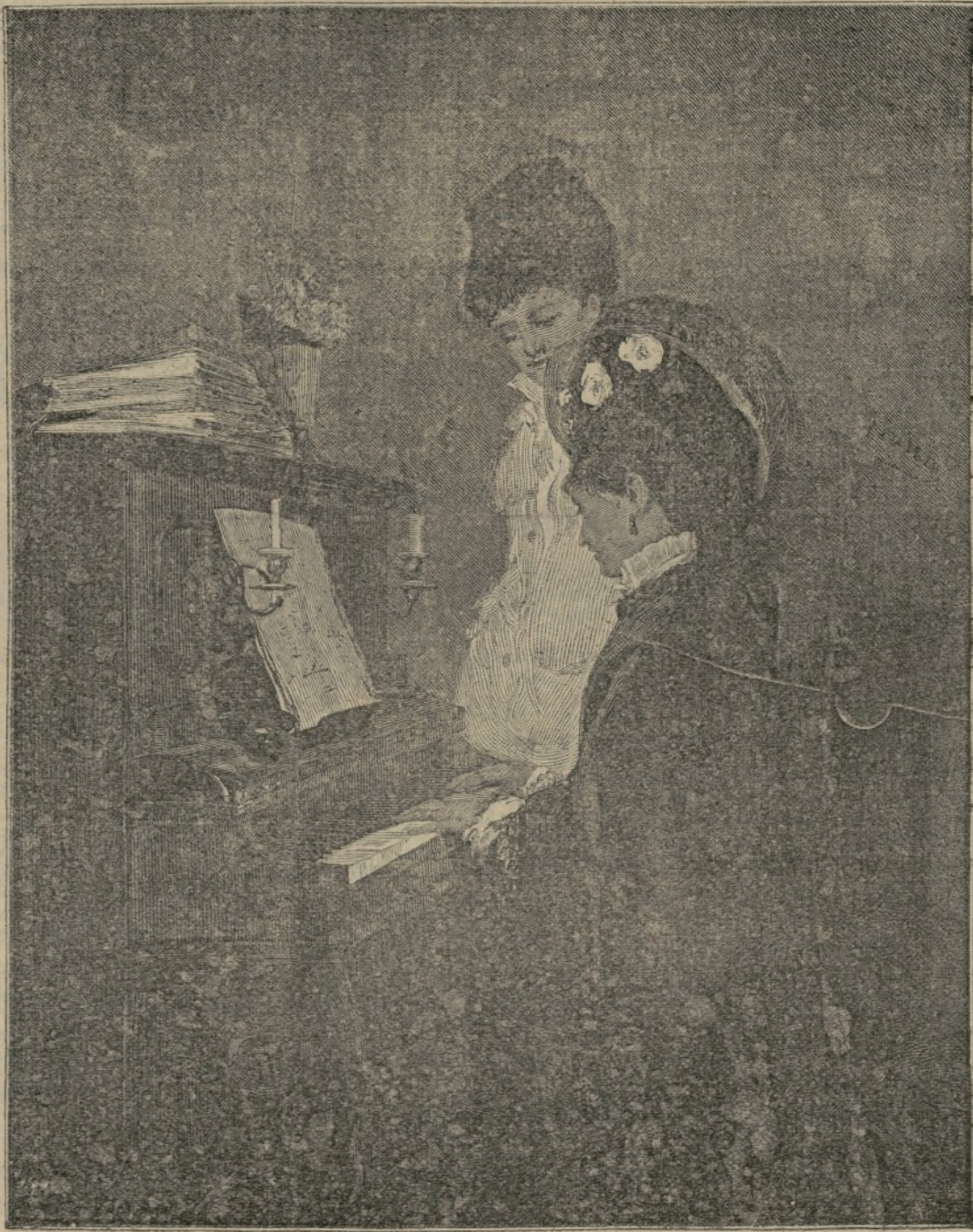
Lección de piano.

Precio: 6 pesetas. Hemos recibido el 17.º cuaderno de la importante obra La tierra de María Santísima , escrita por D. Benito Mas y Prat, con cuadros y viñetas de don J. Garcia y Ramos, y editada por la casa de N. Ramirez y Compañía, de Barcelona. Este cuaderno no desmerece de los anteriores, siendo dignos de mención la preciosa viñeta que sirve de portada, así como los grabados que encierra. Precio del cuaderno: 1 peseta.